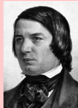
R. Schumann 1810 - 1856