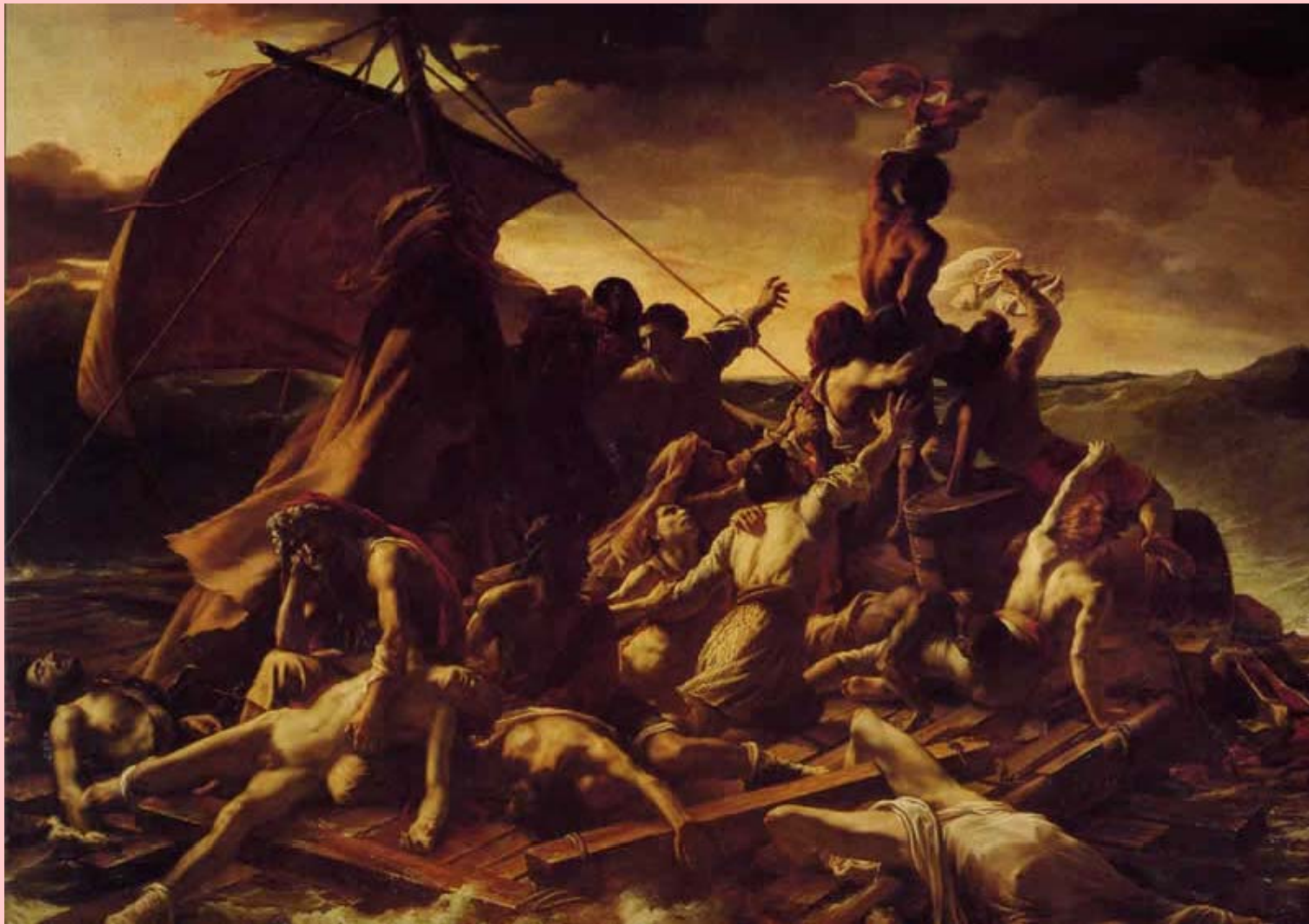
Theodore Géricault, La Zattera della medusa , 1819