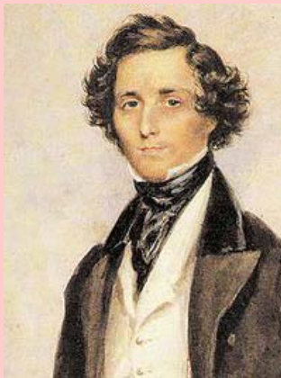
F. Mendelsshon 1809 – 1947