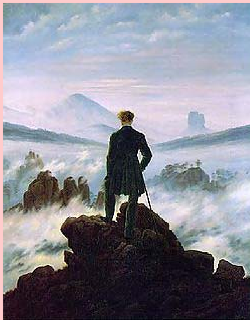
C. D. Friedrich, Il viandante sul mare di nebbia, 1818