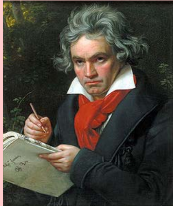
L.V. Beethoven 1770 - 1827