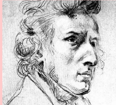
F. Chopin 1810- 1849