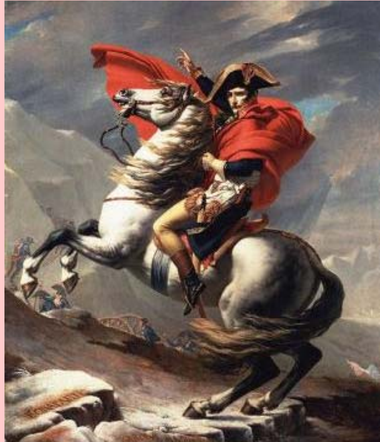
J-L. David, Bonaparte valica il San Bernardo, 1800